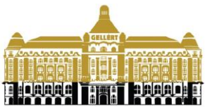
Danubius Hotel Gellért