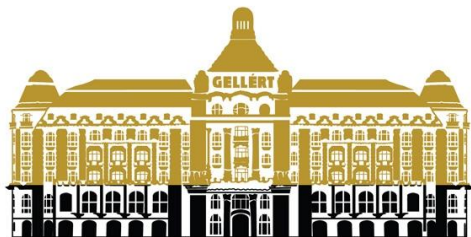
Danubius Hotel Gellért