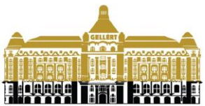
Danubius Hotel Gellért