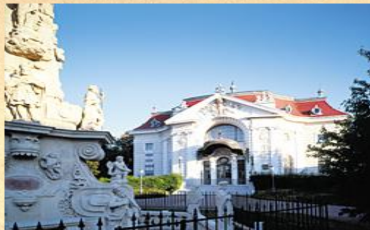
Katona József Színház