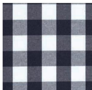
COUNTRY 1* 32x32 cm