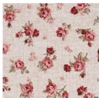
16549-mp106 16x16 cm