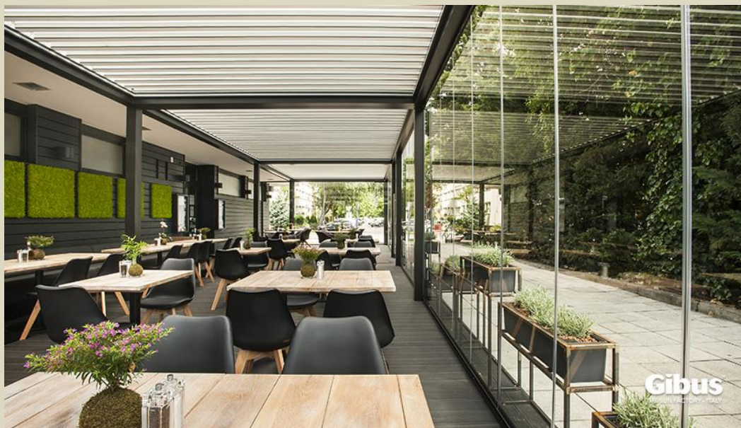
Med Twist Island szerkezetünk

Építész irodánk segítségével a speciális problémák, az átlagostól eltérő megoldások kihívást jelentenek számunkra, és a csapatunkban dolgozó építészek, belsőépítészek, megbízott szakipari mesterek számtalanszor tettek kreativitásukról tanúbizonyságot. Ezen kívül bármilyen komplett teraszok, vagy akár épületek tervezését, kivitelezését is vállaljuk.