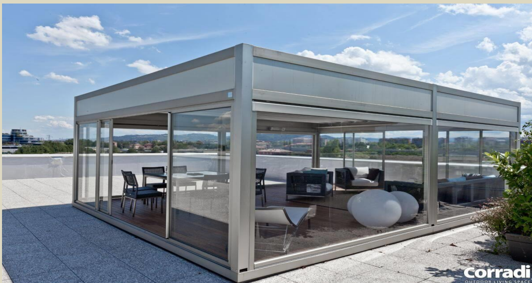
Pergotenda Kubo szerkezetünk

Ezen árnyékoló szerkezetek lehetővé teszik a szállodák (és minden megrendelő) részére azt, hogy a vendégeiket bármilyen időjárási körülmények között fogadni tudják, ugyanis a termék kínálatunkban többféle oldalzárási lehetőség is megtalálható, az átlátszó ponyvától az üvegajtóig sokféle lehetőséggel. Szerkezeteink teteje és oldala mozgatható, függetlenül attól, hogy ponyvás vagy lamellás szerkezet szerepel elképzeléseikben.