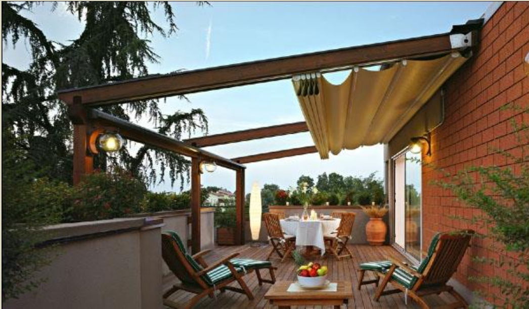
Pergotenda 45 szerkezetünk

A B&B Architektus Kft. eső és viharálló teraszárnyékoló szerkezeteket forgalmaz Magyarországon, elsőként az országban 1995 óta.